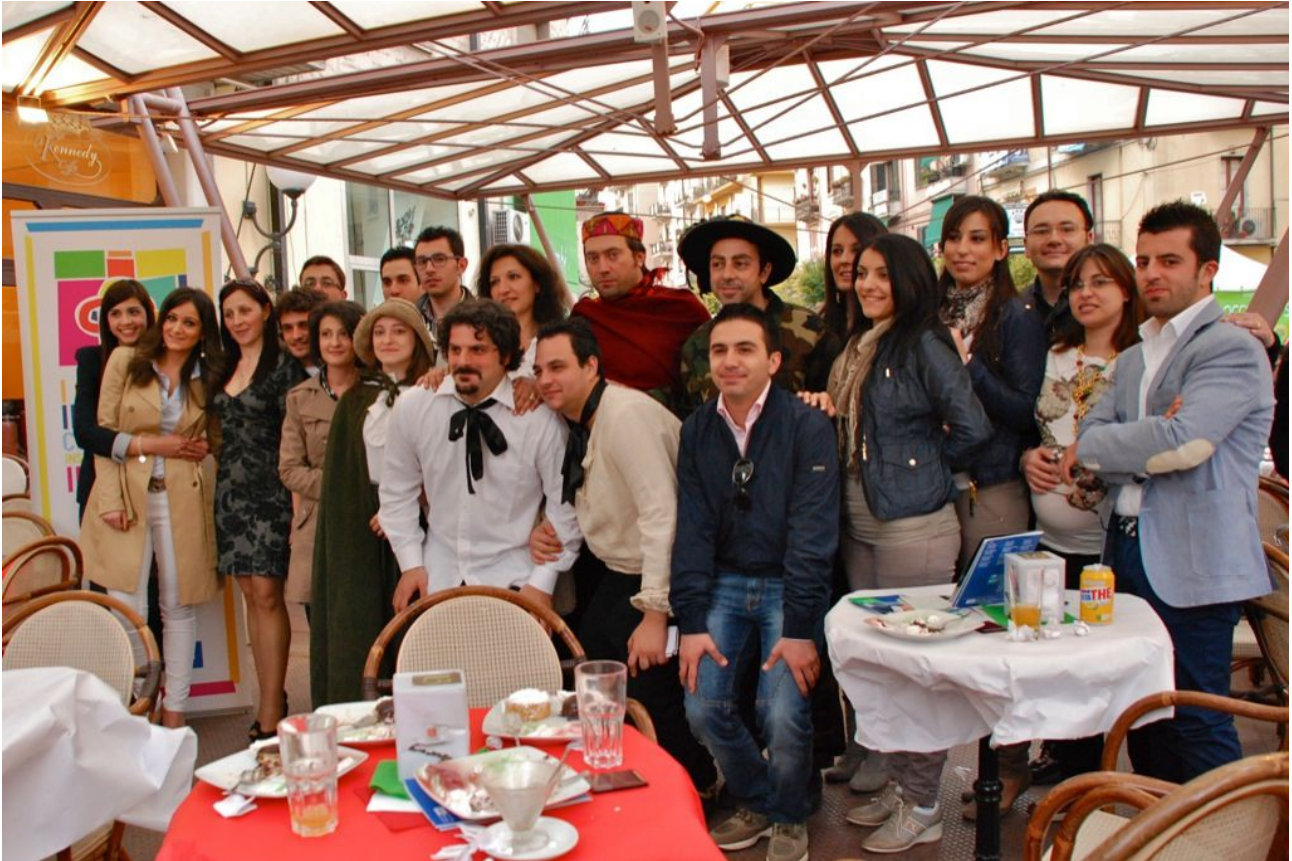
La merenda tricolore. Foto di gruppo con gli artisti

Un'attenzione particolare è stata posta nel corso dell'anno al territorio e alla sua storia. In tal senso, per rendere omaggio ai 150 anni dell'Unità d'Italia, è stata organizzata l'8 Maggio a Cosenza l'iniziativa " La Merenda Tricolore" .