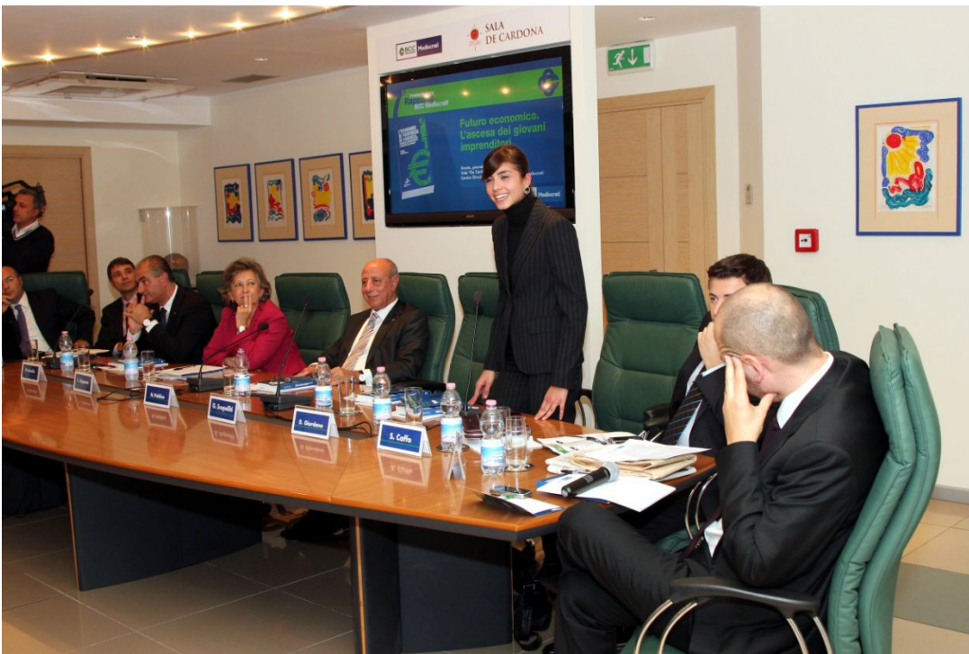
7° Rapporto Mediocrati sull’economia cosentina. La parola al Club dei Giovani Soci

E’ un coinvolgimento in costante crescita quello dei Giovani Soci e del Club nella vita della BCC Mediocrati. Ne sono esempi la partecipazione del Club all’Assemblea annuale dei Soci della Banca, sia nella fase organizzativa che durante i lavori, e la sua partecipazione e il suo intervento alla presentazione del VII Rapporto sull’economia cosentina.