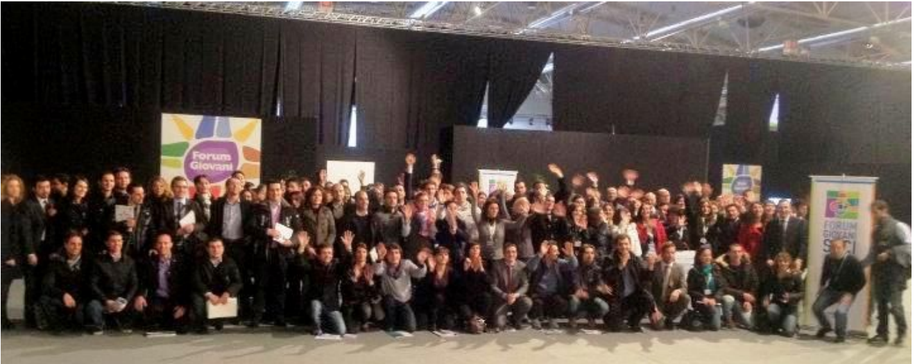
Roma - Forum Giovani Soci BCC – foto di... gruppone

Il Club Giovani Soci BCC Mediocrati è in stretto contatto con le altre realtà associative giovanili delle BCC italiane (club, consulte, gruppi giovani soci etc.), sia attraverso incontri a cadenza periodica che attraverso spazi di confronto virtuali.