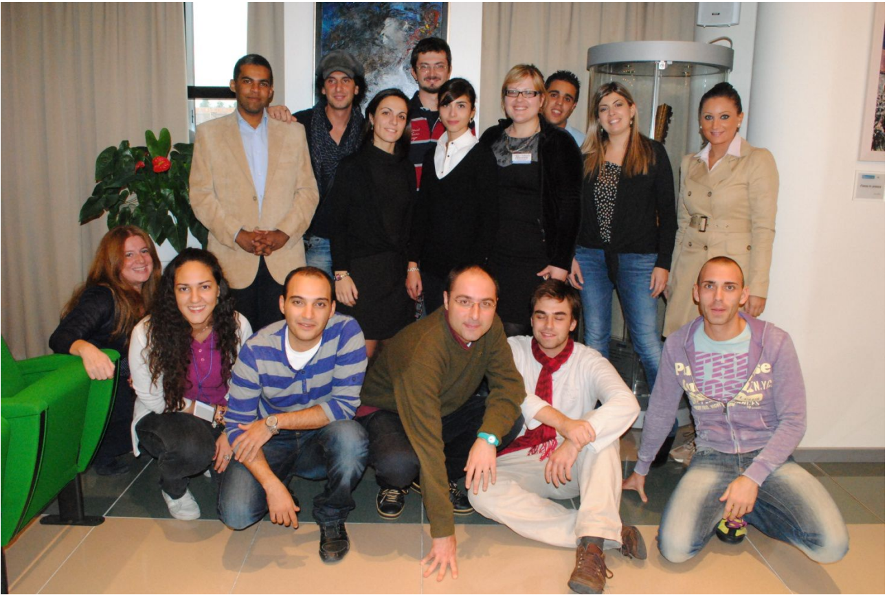
MeYouMe, gruppo multietnico nella Sala De Cardona

Diversi i temi al centro dell'incontro: dal ruolo della cooperazione, alla storia e ai valori cardine del credito cooperativo.