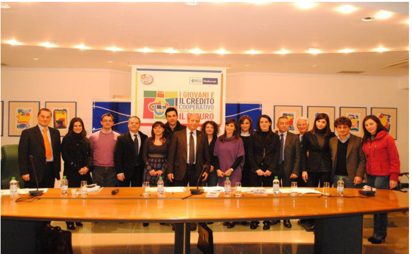
Il primo Consiglio Direttivo del Club Giovani Soci, al termine dell'Assemblea costituente.

Nel corso del 2011, il Consiglio Direttivo si è riunito 29 volte.