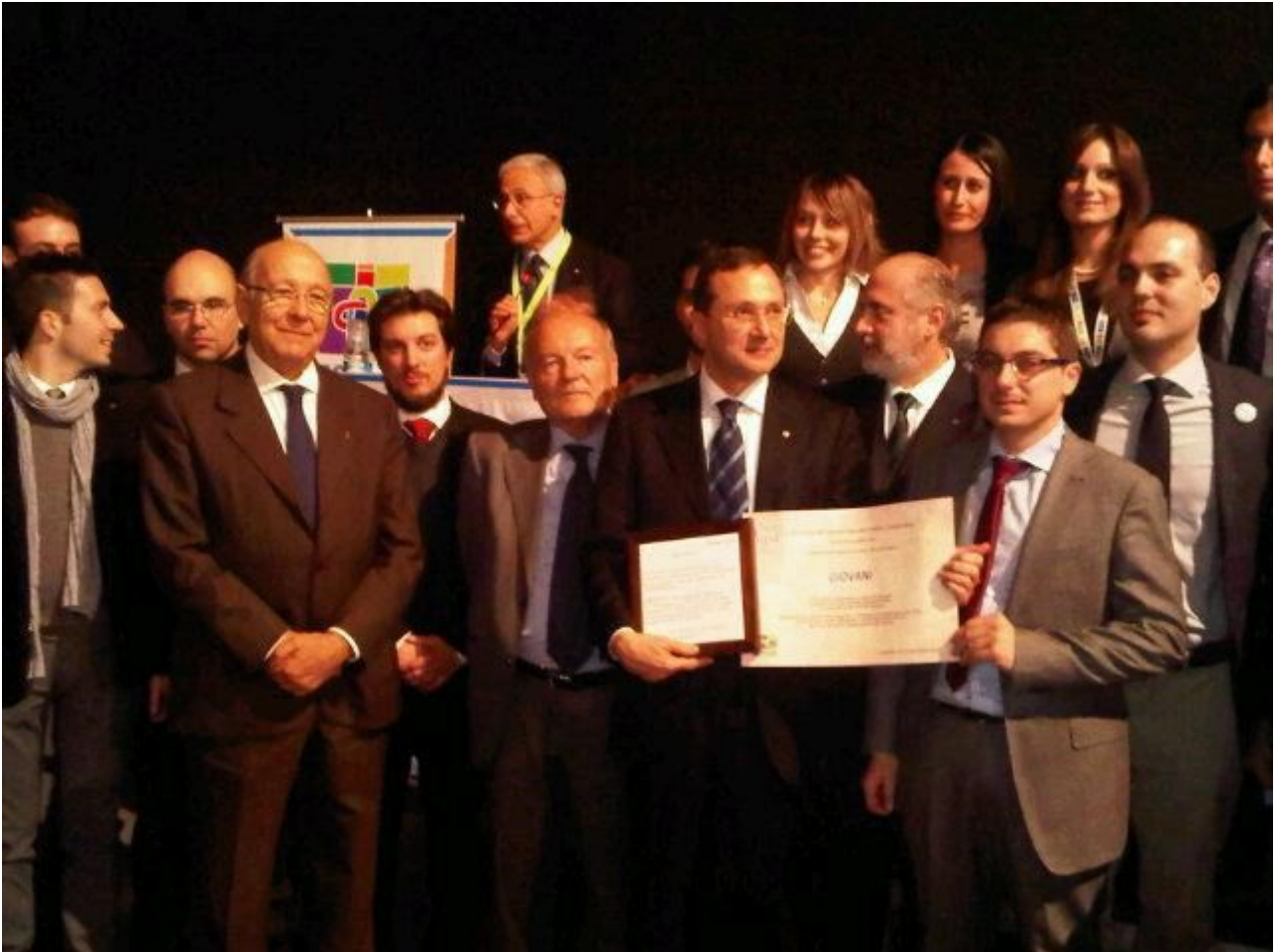
Roma - Forum Giovani Soci

Il Forum di Roma per il Club ha rappresentato uno spazio importante di confronto e di condivisione di idee ed esperienze con le altre associazioni, in vista della costruzione di una futura rete nazionale.