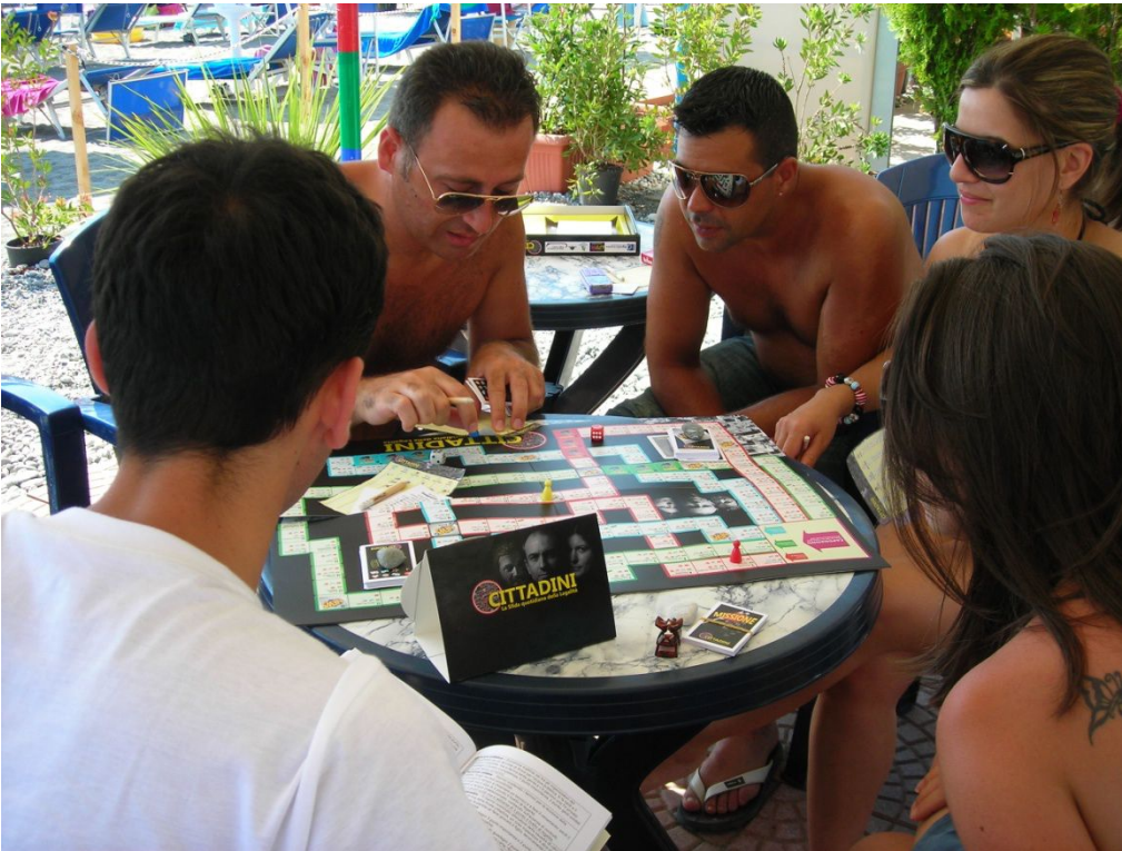
Giovani soci impegnati al tavolo di "Io gioco pulito"

Attraverso il torneo di beach volley e il gioco da tavolo "Cittadini. La sfida quotidiana della Legalità", ideato e prodotto dalla cooperativa "Dignità del Lavoro" con il sostegno dell'associazione "Libera" e con il contributo della BCC Mediocrati, i Giovani Soci hanno potuto riflettere su come il rispetto da parte di ognuno delle norme e dei canoni comportamentali nelle piccole scelte quotidiane possa contribuire alla crescita dell'intera collettività e su come le scelte sbagliate dei singoli possano far abbassare il livello di legalità dell'intera società.