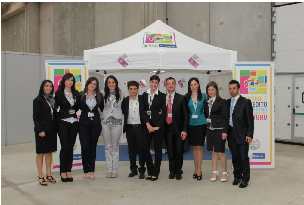
Maggio 2011 - Assemblea dei Soci – Corner del Club

La Banca rappresenta uno dei principali portatori di interesse del Club fin dalla sua costituzione. Ricordiamo infatti, che l'associazione dei Giovani Soci è nata grazie all'impulso della Banca.