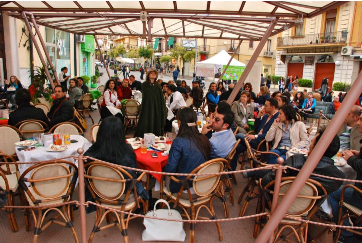
La merenda tricolore.

Durante questo primo anno di attività il Consiglio Direttivo ha pensato di far conoscere e diffondere tra i giovani soci i valori cardine del credito cooperativo.