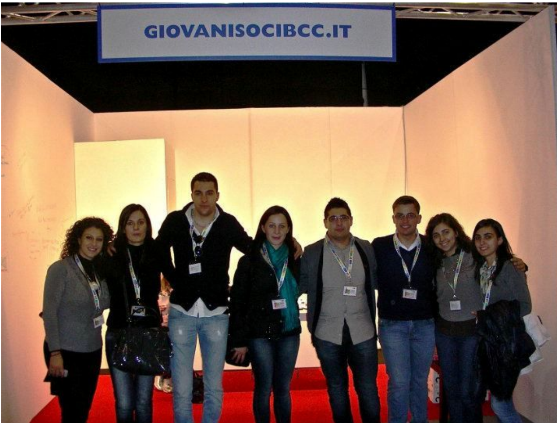
Congresso Nazionale BCC - Giovani Soci BCC Mediocrati nello stand prima dell'allestimento

Nel corso del Forum il Club insieme ad altre sette realtà associative, ha illustrato i contenuti del volume dal titolo "Scrivere il futuro. Come creare e far crescere gruppi di giovani soci nelle BCC-CR". Nel libro, che sarà distribuito a tutte le BCC italiane, è presente anche l'esperienza del nostro Club.