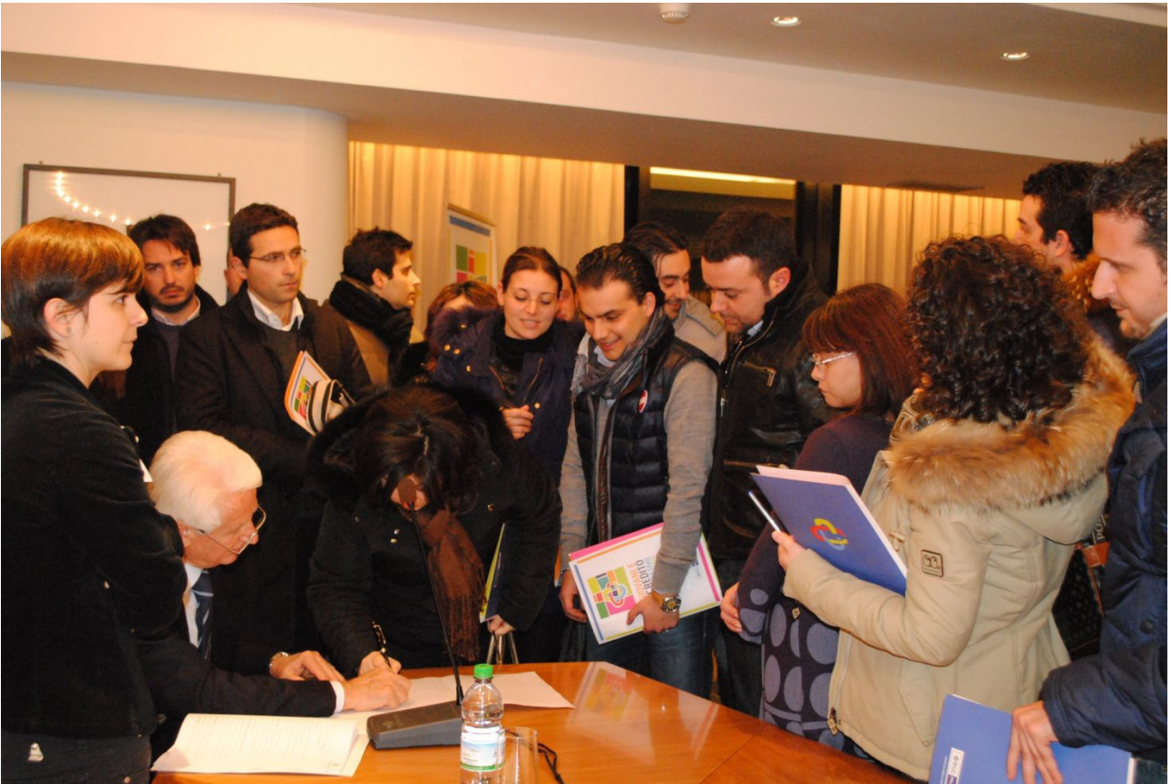
Giovani Soci firmano l'atto costitutivo del Club dinanzi al notaio Gisonna

Costituente, durante la quale l'associazione si è costituita dinanzi al notaio, eleggendo le cariche sociali.