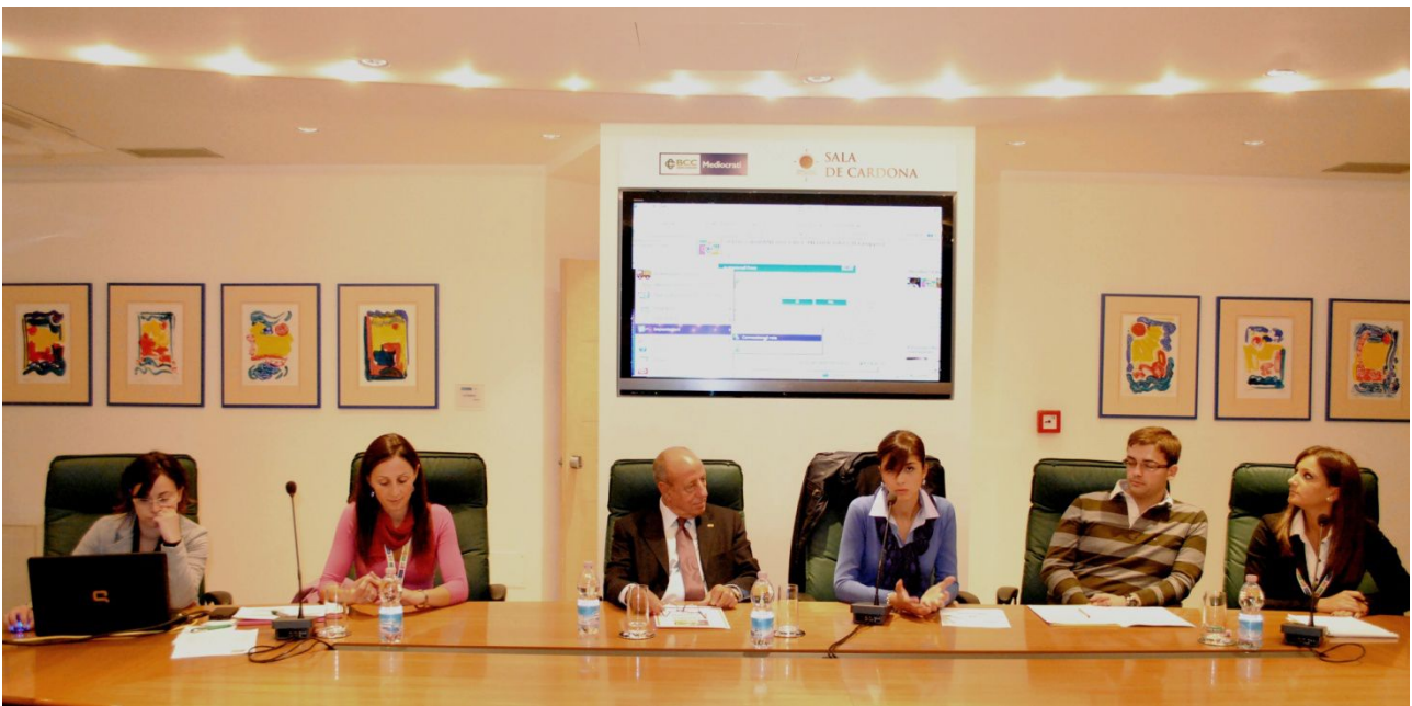
Assemblea Straordinaria del 14 ottobre 2011, con "diretta" facebook