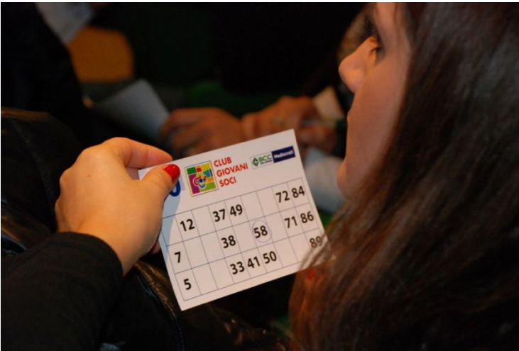
"Il Club dà i numeri". Tombolata 2011