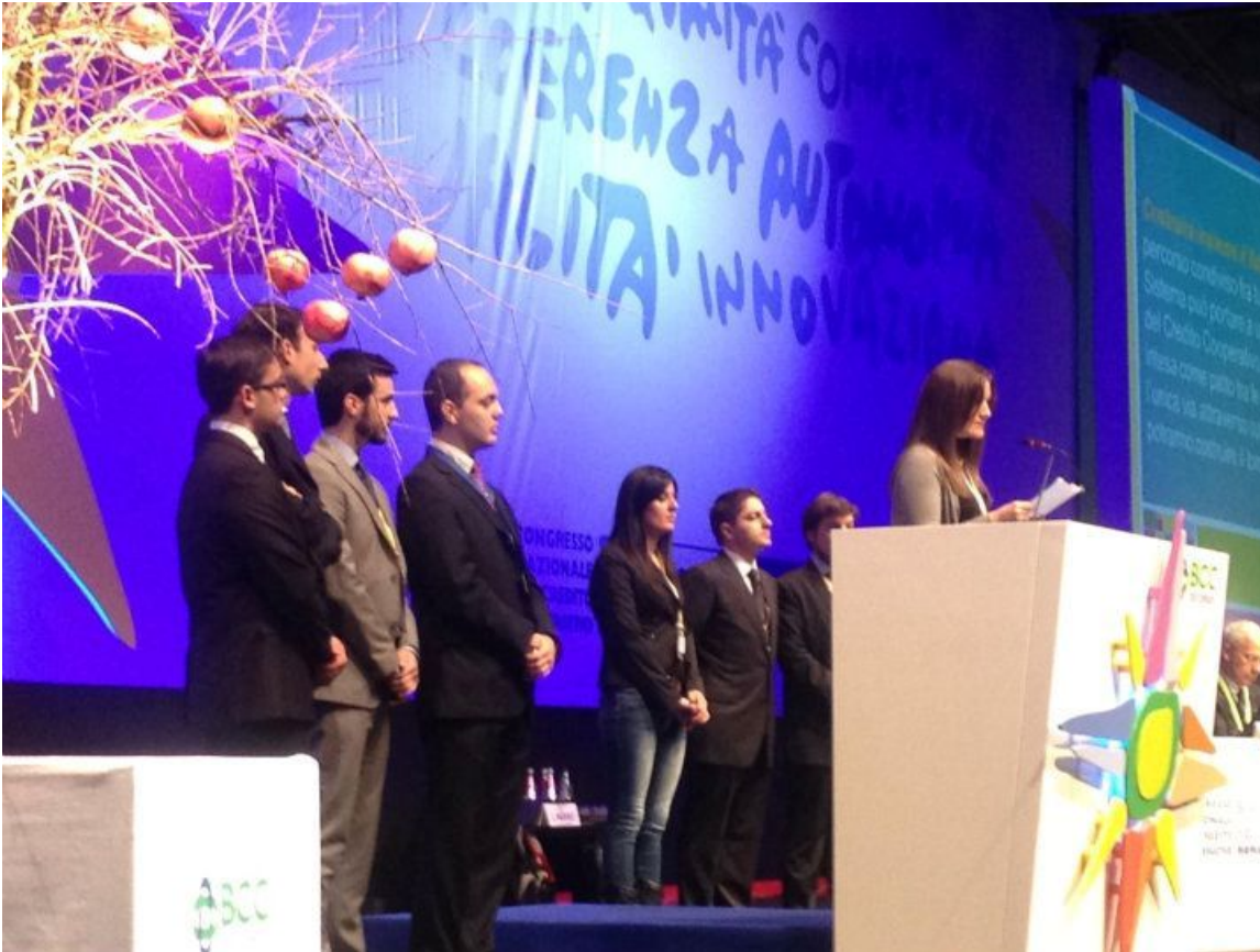
Roma – Il Club Giovani Soci BCC Mediocristi sul palco del XIV Congresso Nazionale

Durante l'ultima giornata, insieme alle associazioni dei Giovani Soci delle BCC "Don Rizzo", "Giuseppe Toniolo", del Garda, di Roma, d'Anaunia, di Vignole e di Trento, il Club dei Giovani Soci ha proposto davanti alla platea dei congressisti la bozza di un nuovo articolo dedicato ai giovani da inserire nella Carta dei Valori.